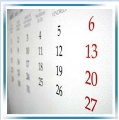
Competitie voetballen op een ander moment.

Geïnteresseerde verenigingen worden uitgenodigd voor een brainstormsessie. Verder is het van belang dat de mogelijkheden binnen de verenigingen worden geïnventariseerd en er draagvlak wordt gecreëerd.