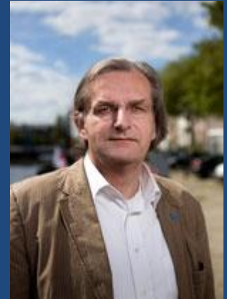
Wethouder Gerrit Piek